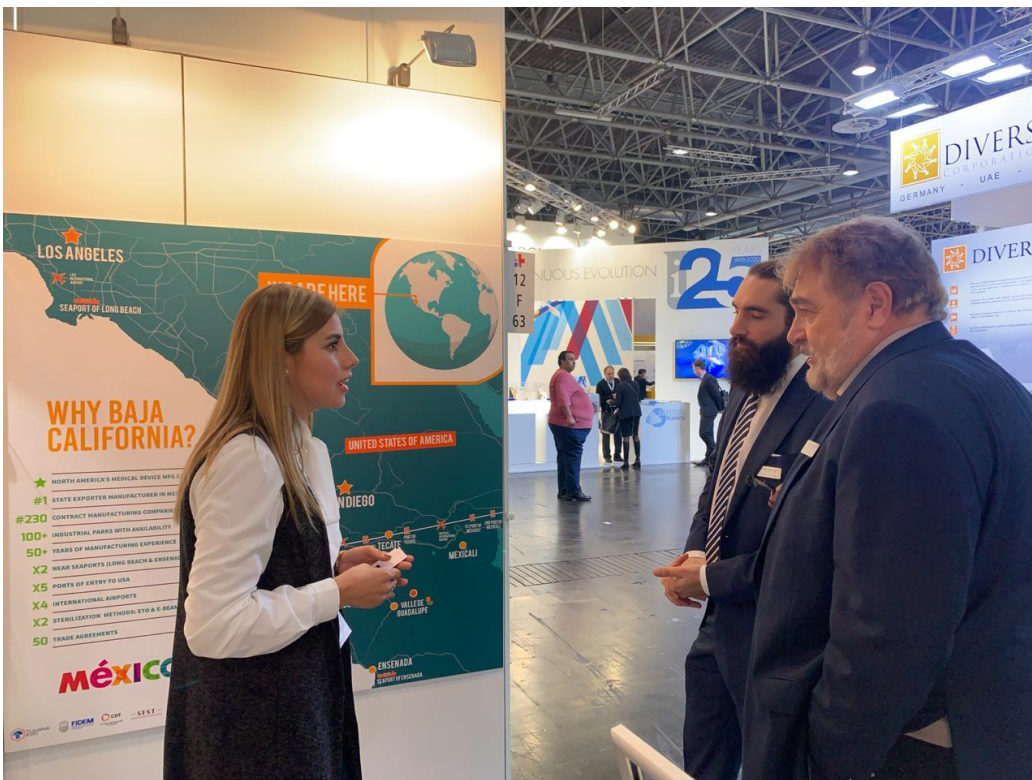
-Reunión con empresa Hega-Medical.