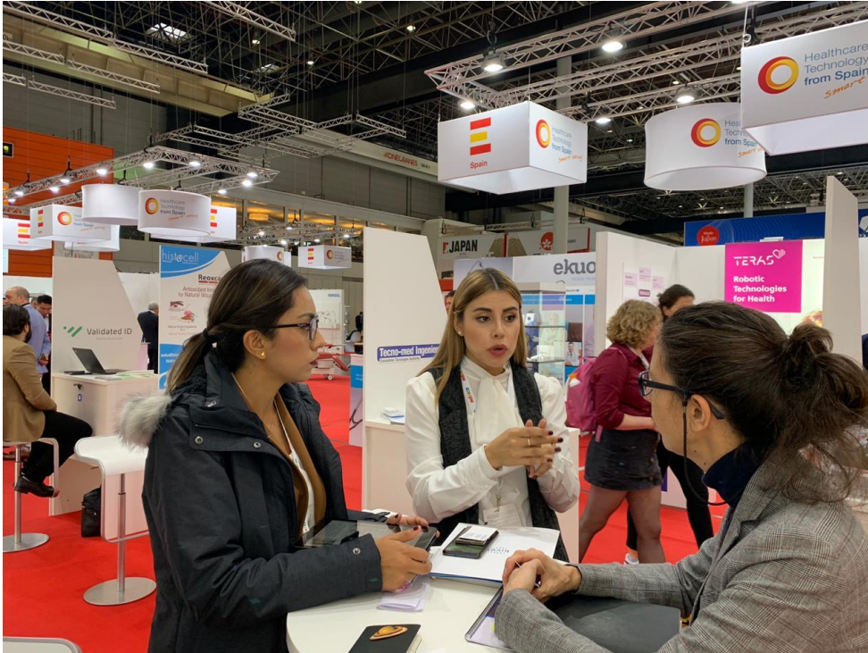
-Reunión con empresa Devimetrix.