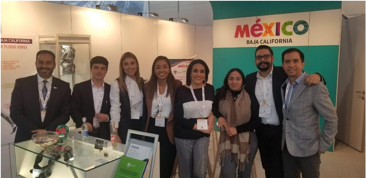
-Delegación Baja California atendiendo evento MEDICA.