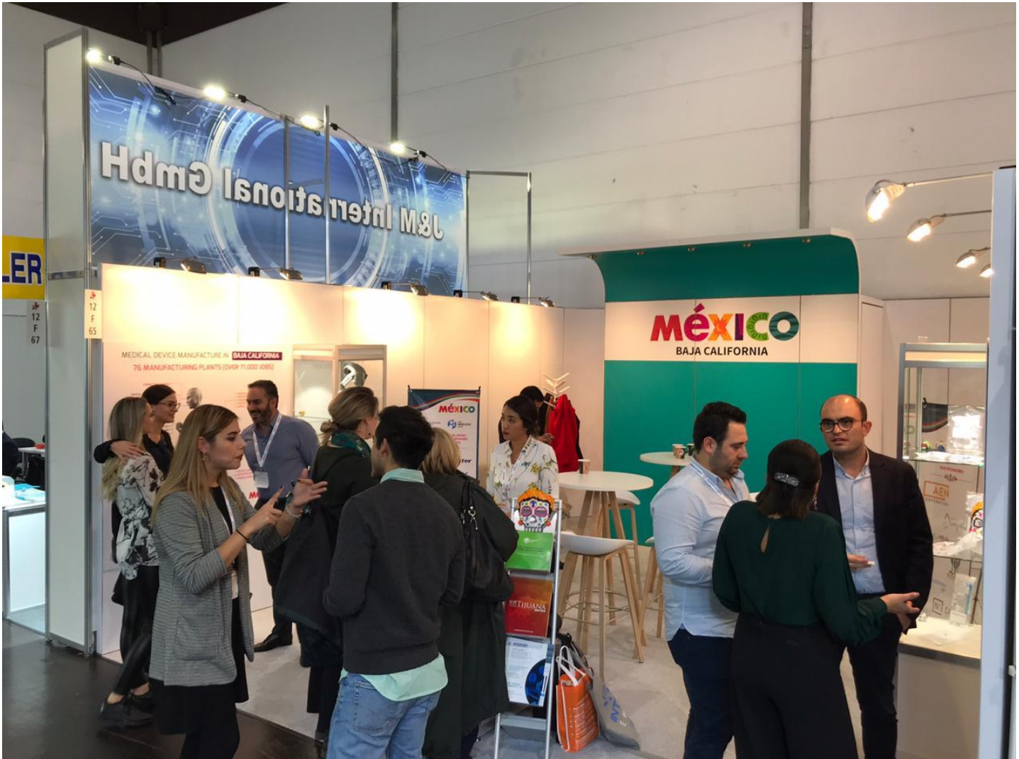
-Atención en booth por parte de la Delegación.