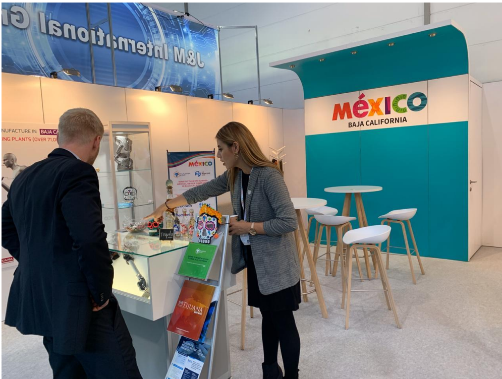
-Atención a organismo de promoción alemán.